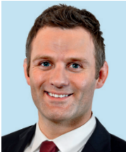
Ole Bischof Vizepräsident Leistungssport Deutscher Olympischer Sportbund