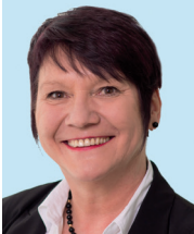
Elvira Menzer-Haasis Präsidentin Landessportverband Baden-Württemberg